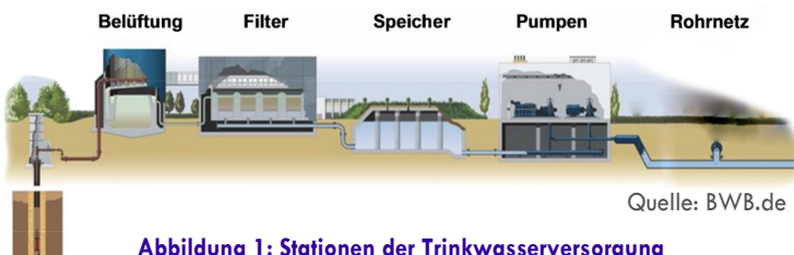
Abbildung 1: Stationen der Trinkwasserversorgung

Die Qualität des Trinkwassers in Deutschland ist sehr hoch. Trinkwasser gilt nach Aussagen der Versorger zu Recht als das best-kontrollierte Lebensmittel. Sicherergestellt wird das unter anderem durch ein durchdachtes Risikomanagement und regelmäßige wiederholende Überprüfungen der Technik und der Qualität. Der Wasserversorger garantiert die Qualität des Trinkwassers von der Quelle bis zur Übergabestelle, d.h. bis zum jeweiligen Hausanschluss im Gebäude. Ab dem Übergabepunkt ist der Gebäudebetreiber (USI - Unternehmer oder sonstige Inhaber) für die Trinkwasser-Qualität verantwortlich.