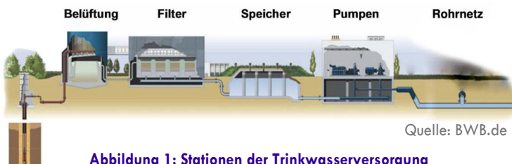
Abbildung 1: Stationen der Trinkwasserversorgung

Die Qualität des Trinkwassers in Deutschland ist sehr hoch. Trinkwasser gilt nach Aussagen der Versorger zu Recht als das best-kontrollierte Lebensmittel. Sicherergestellt wird das unter anderem durch ein durchdachtes Risikomanagement und regelmäßige wiederholende Überprüfungen der Technik und der Qualität. Der Wasserversorger garantiert die Qualität des Trinkwassers von der Quelle bis zur Übergabestelle, d.h. bis zum jeweiligen Hausanschluss im Gebäude. Ab dem Übergabepunkt ist der Gebäudebetreiber (USI - Unternehmer oder sonstige Inhaber) für die Trinkwasser-Qualität verantwortlich.